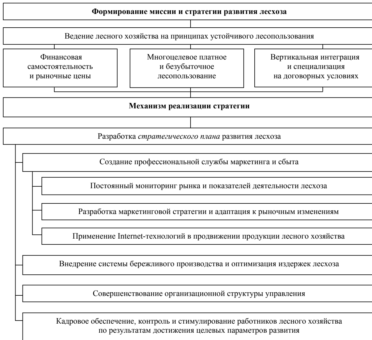
Рис. 2. Механизм формирования и реализации стратегии развития лесхоза